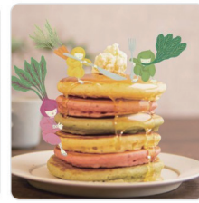
忍んでいるのは伊賀のお野菜 「忍者パンケーキ」