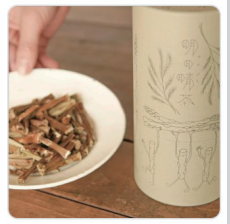
アスパラガスのお茶 「明日晴茶」