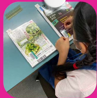
本の装備 本の選書 など

実施日 7月25日・26日・27日・28日 8月1日・2日・3日・4日 (※8月3・4日はプレミアム探検隊)