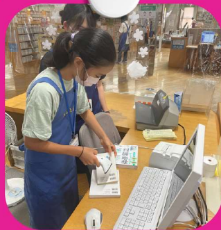
貸出・返却作業 紙芝居の読み聞かせ