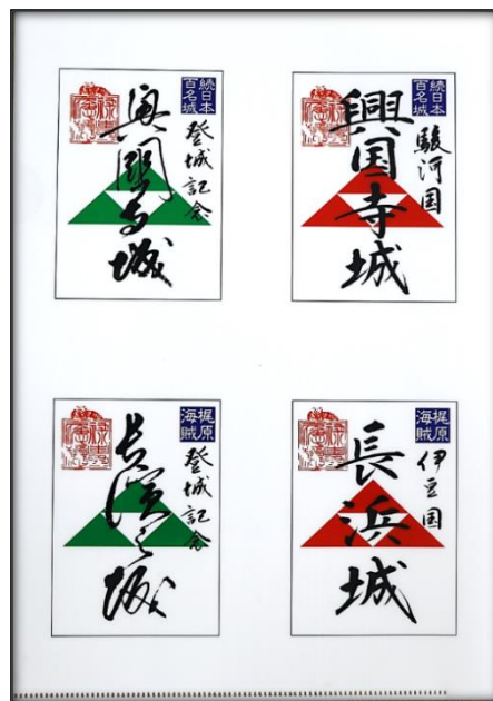
御城印クリアファイル

4 景 品 御城印クリアファイル ・5問正解 → 1枚 ・10問正解 → 2枚 ・15問正解 → 3枚 ・全問正解(19問) → 5枚 ※参加賞も用意しています。 ※景品の受け渡し場所は、 沼津市文化財センター (平日のみ 9:00～17:00)