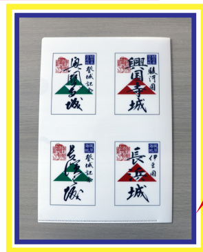
興国寺城跡・長浜城跡の 御城印クリアファイル!