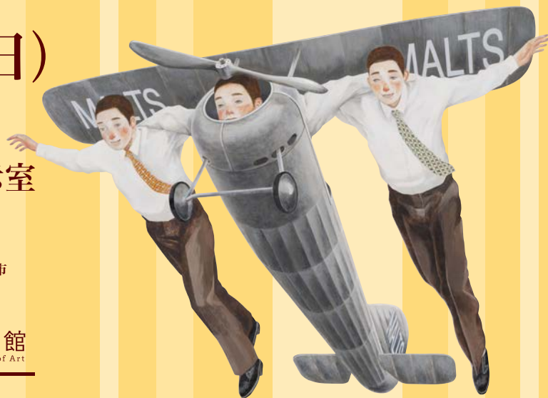
石田徹也(ピアガーデン発)(部分)

主催: 静岡県立美術館、(公財)沼津市振興公社 共催: 沼津市教育委員会 後援: 沼津市