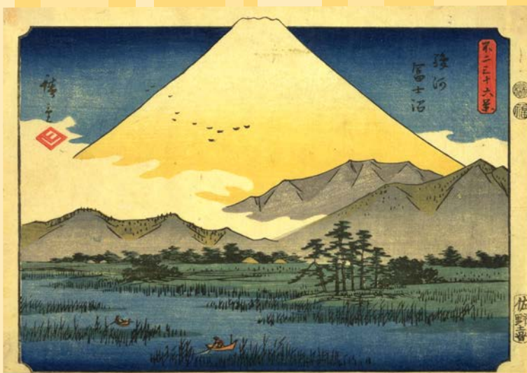
歌川広重 (不二三十六景 / 駿河富士沼)