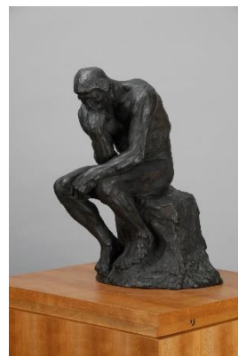
オーギュスト・ロダン《考える人》