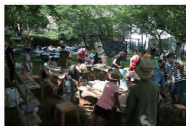
前回のワークショップの様子です