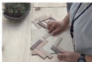
ヘリンボーン柄組み立ての様子