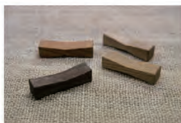
ちぎりの箸置きも作れます