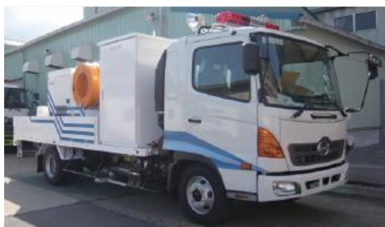
(排水ポンプ車イメージ)