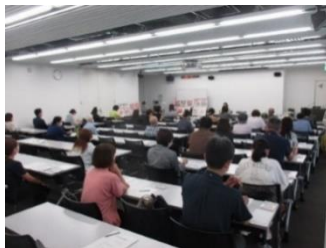
▲ 令和4年度の動物愛護講演会の様子