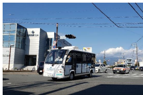
＜沼津港を走行する自動運転車両＞