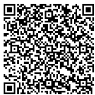
【お申込みはコチラ】

・マイナポータルからのお申込みも可能です。QRコードを読み取り、お申込みにお進みください。マイナンバーカードをお持ちでない方でもお申込みできます。