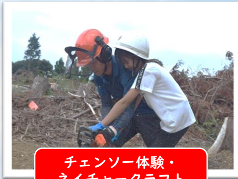
チェーンソー体験・ ネイチャークラフト