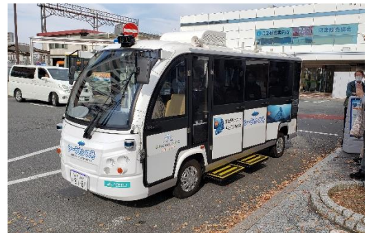
(昨年度の実証実験)