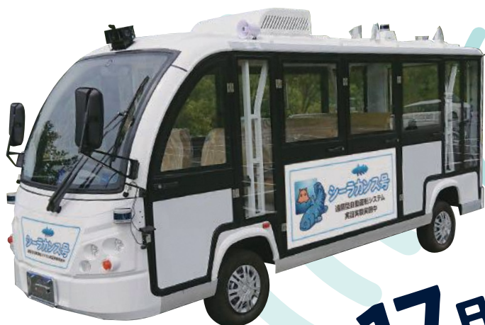
▲シーラカンス号 (EV車両)