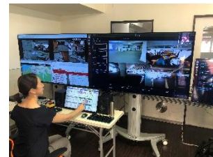
(コントロールセンター)