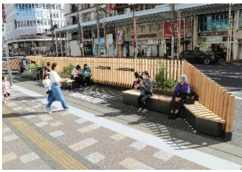
パークレット (10月21日から約1年半設置)