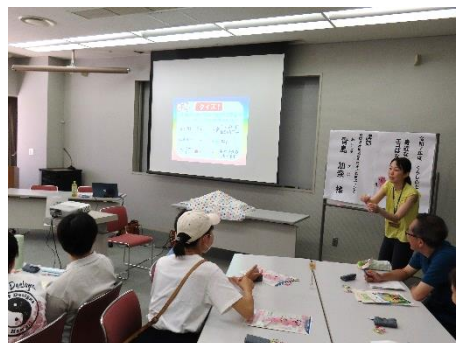
今年度で開催したセミナーの様子