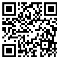
申込み専用フォーム