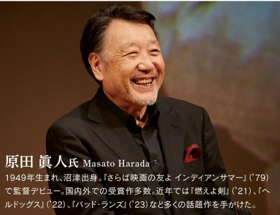
原田 真人氏 Masato Harada

沼津市出身の映画監督・原田真人氏の逝去を受け、その功績を偲ぶとともに、2026年4月12日をもって閉館するシネマサンシャイン沼津への感謝の意を込めて、原田監督作品『わが母の記』の特別上映およびトークイベントを開催。