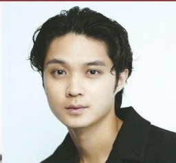
磯村 勇斗氏 Hayato Isomura

俳優・映画編集・プロデューサー。『わが母の記』でも編集を担当し、日本アカデミー賞 優秀編集賞受賞。