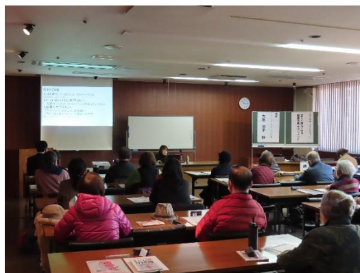
昨年度開催したセミナーの様子