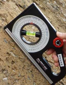
市盛土基準を満たしていない