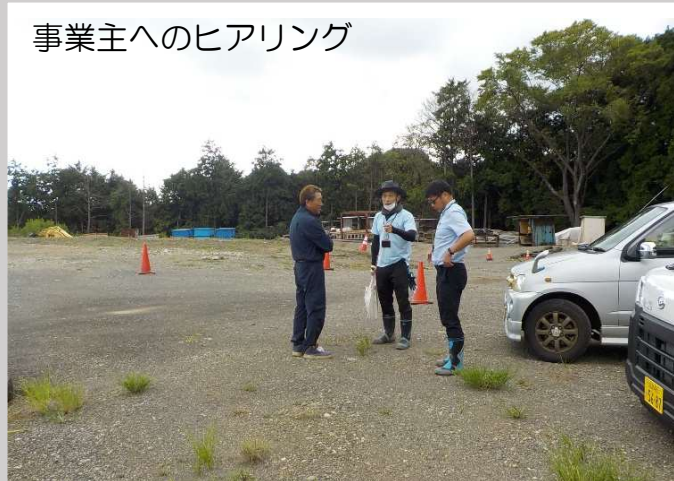
事業主へのヒアリング