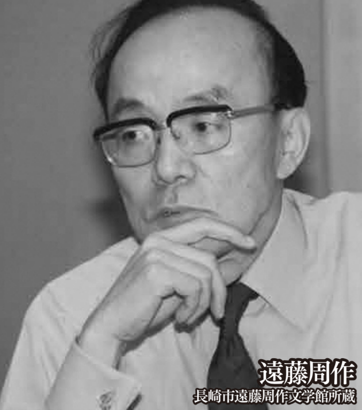
遠藤周作