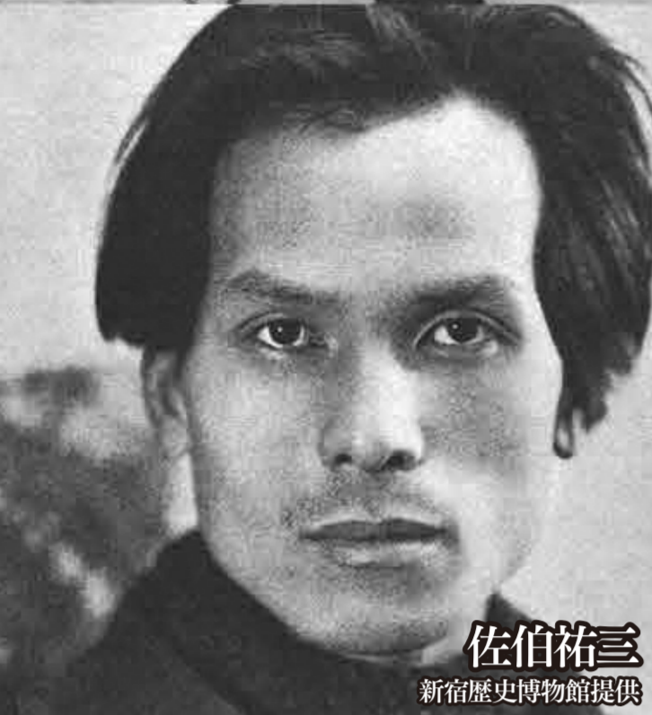
佐伯祐三 新宿歴史博物館提供