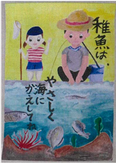
小学生 高学年の部