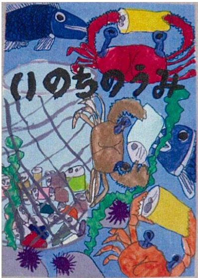
小学生 低学年の部