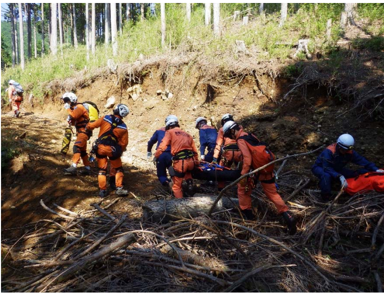
静岡県消防防災航空隊と協力し、要救助者を救出している様子

※ 山岳救助訓練を取材される場合は、午前8時45分までに★地点（少年自然の家を北に上がっていき、林道との合流する場所）に来ていただければ、報道対応者が訓練実施場所まで案内いたします。