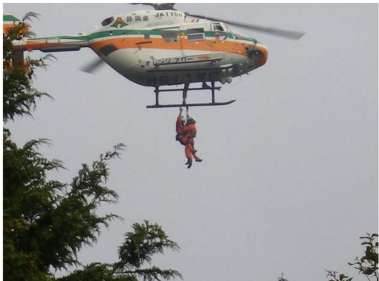
要救助者をピックアップ救出している様子