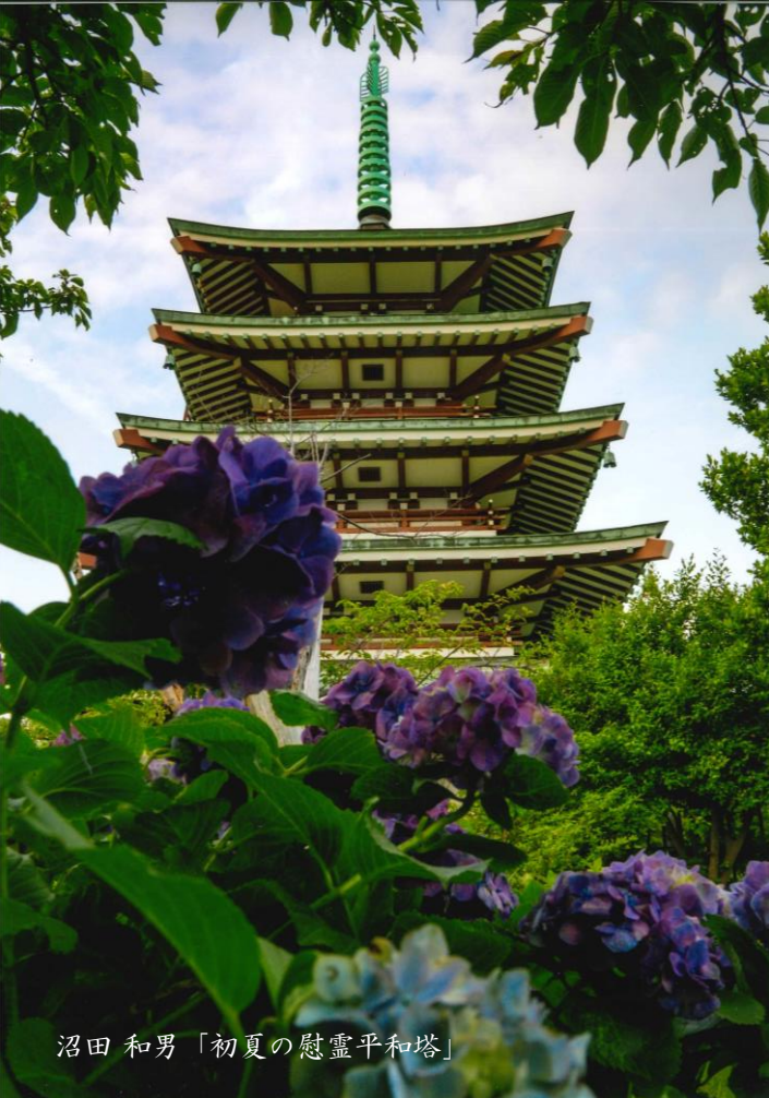
沼田 和男「初夏の慰霊平和塔」