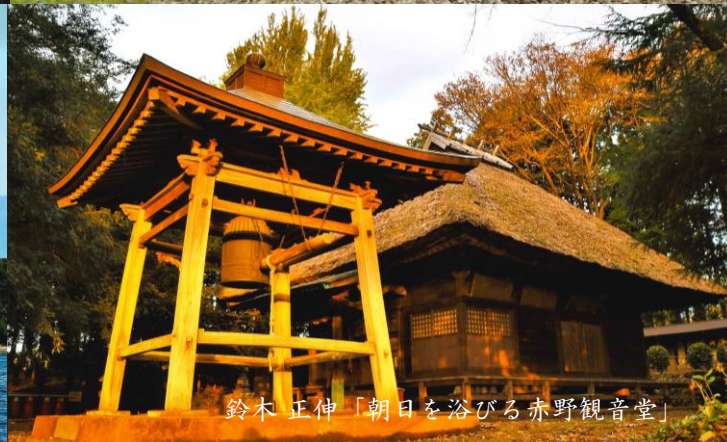
鈴木 正伸「朝日を浴びる赤野観音堂」