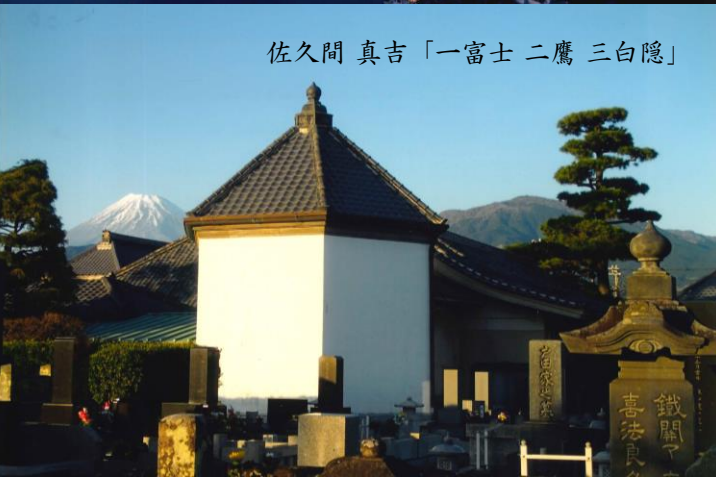
佐久間 真吉「一富士 二鷹 三白隠」