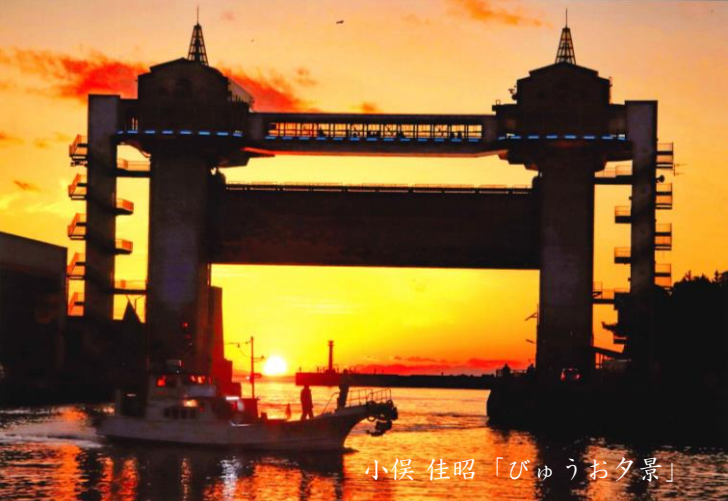
小俣 佳昭「びゅうお夕景」