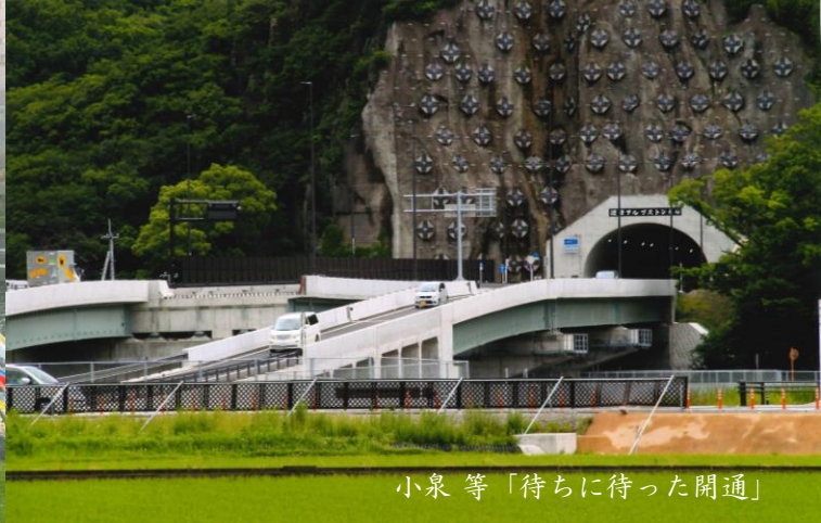
小泉 等「待ちに待った開通」