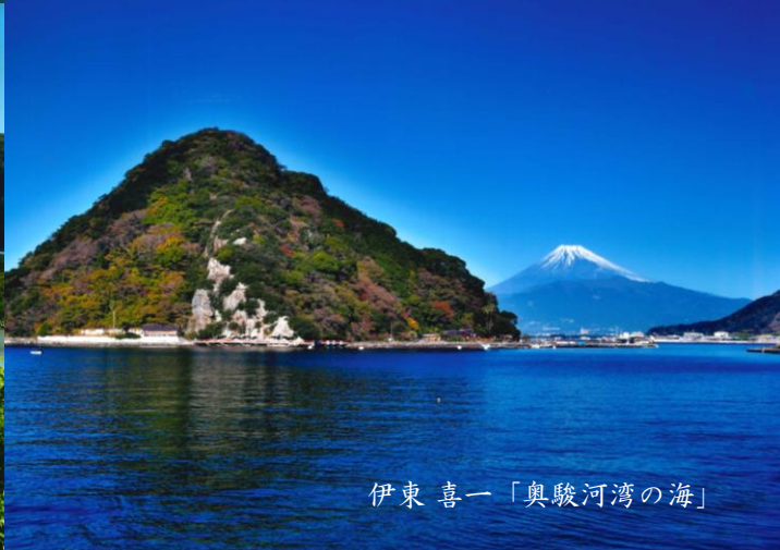
伊東 喜一「奥駿河湾の海」