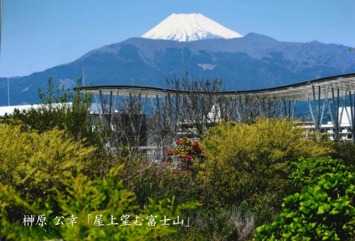
榊原 公幸「屋上望む富士山」