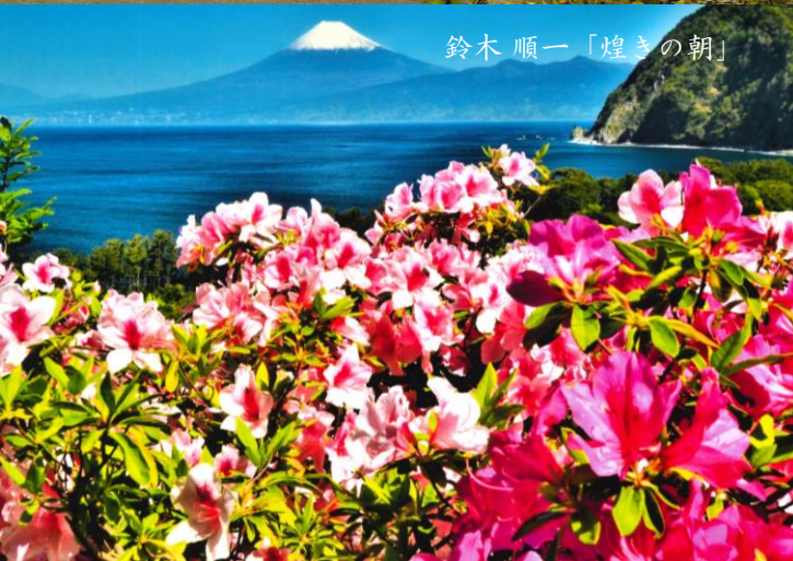
鈴木 順一「煌きの朝」