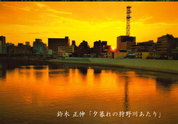
鈴木 正伸「夕暮れの狩野川あたり」