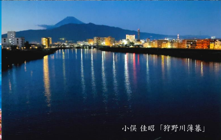
小俣 佳昭「狩野川薄暮」