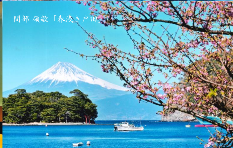
間部 碩敏「春浅き戸田」