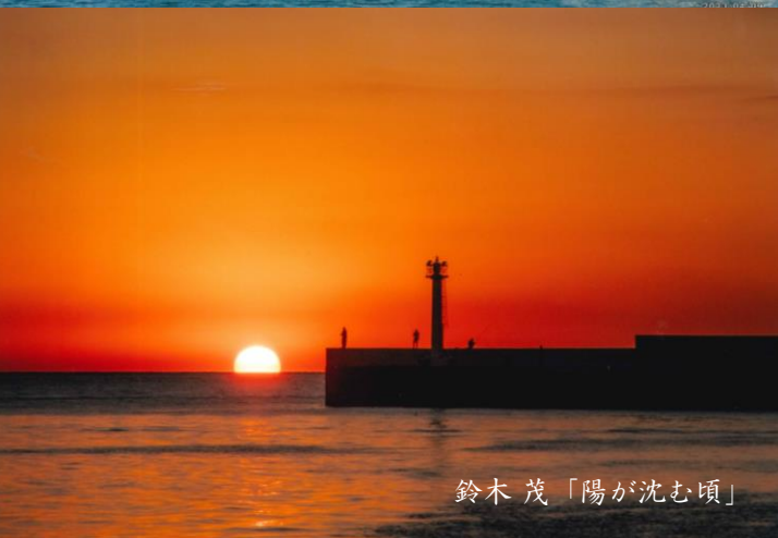
鈴木 茂「陽が沈む頃」