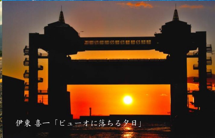
伊東 喜一「ビューオに落ちる夕日」