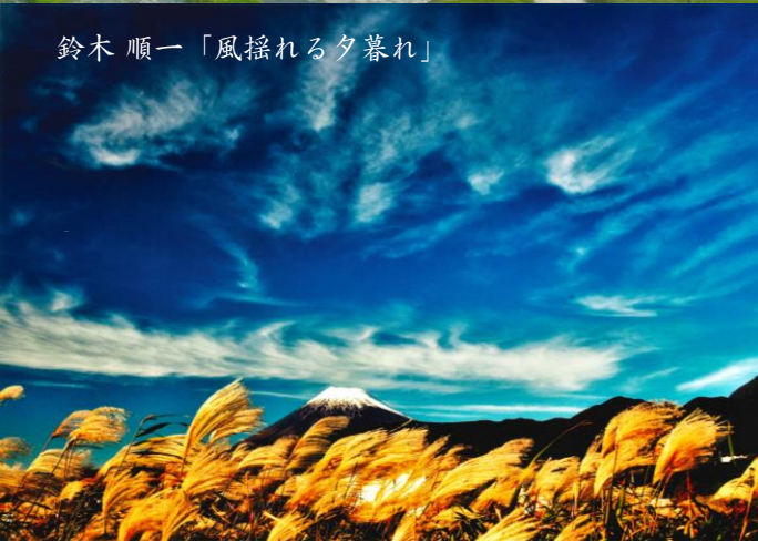
鈴木 順一「風揺れる夕暮れ」