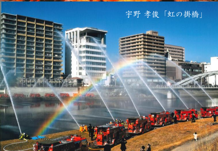
宇野 孝俊「虹の掛橋」