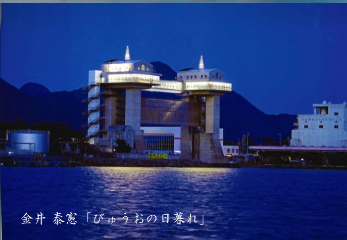
金井 泰憲「びゅうおの日暮れ」