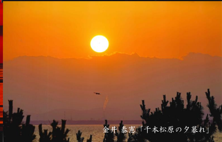
金井 泰憲「千本松原の夕暮れ」