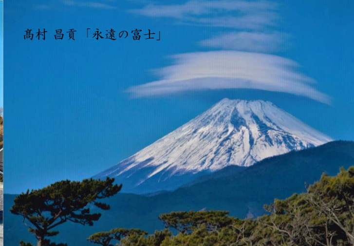
高村 昌貢「永遠の富士」