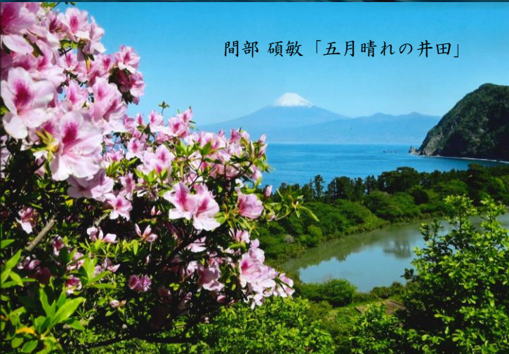
間部 碩敏「五月晴れの井田」