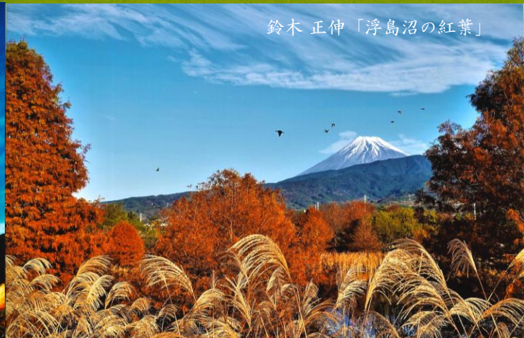
鈴木 正伸「浮島沼の紅葉」