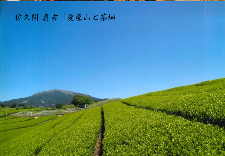
佐久間 真吉「愛鷹山と茶畑」