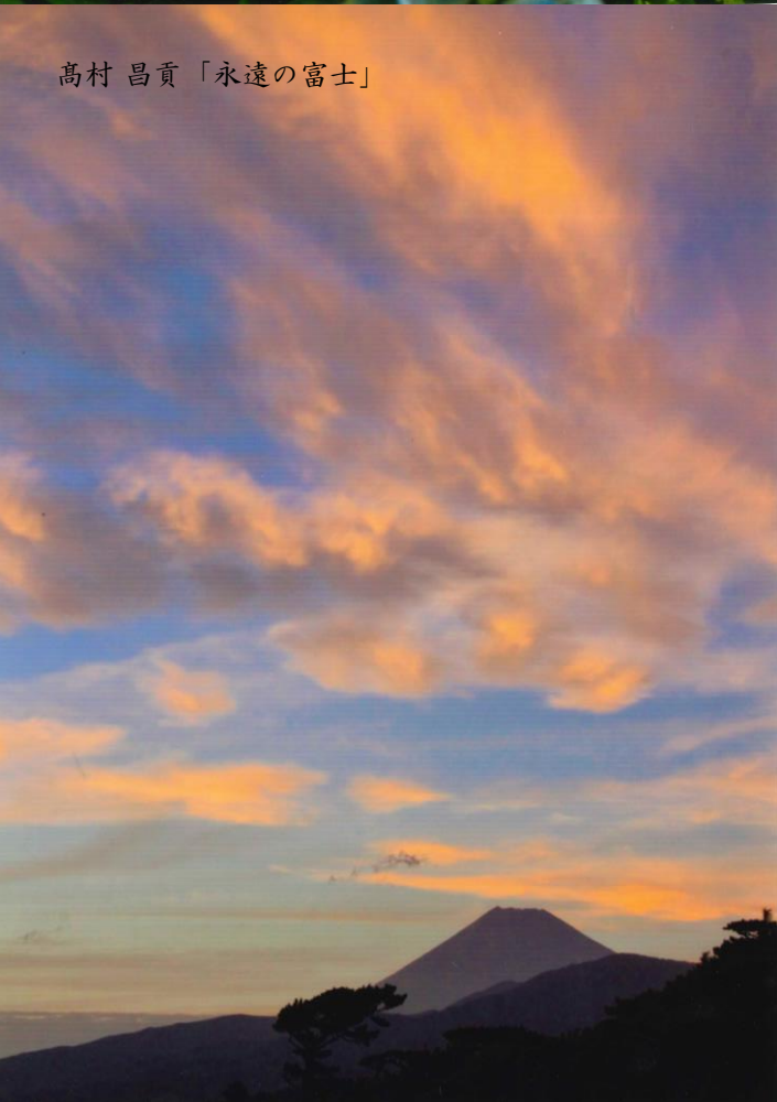
高村 昌貢「永遠の富士」