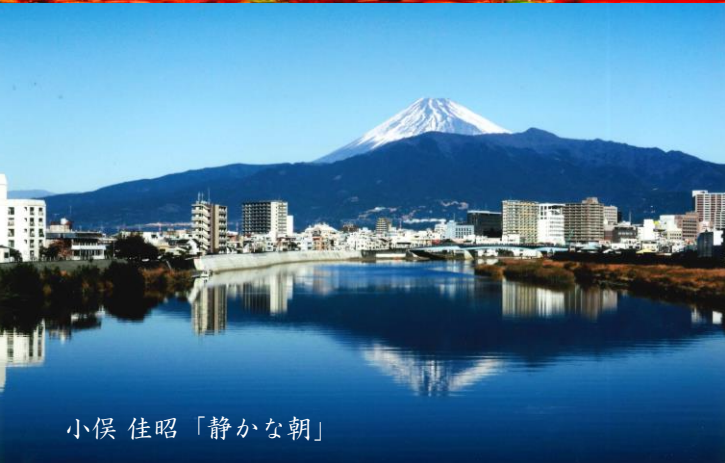
小俣 佳昭「静かな朝」