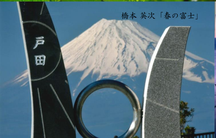
橋本 英次「春の富士」