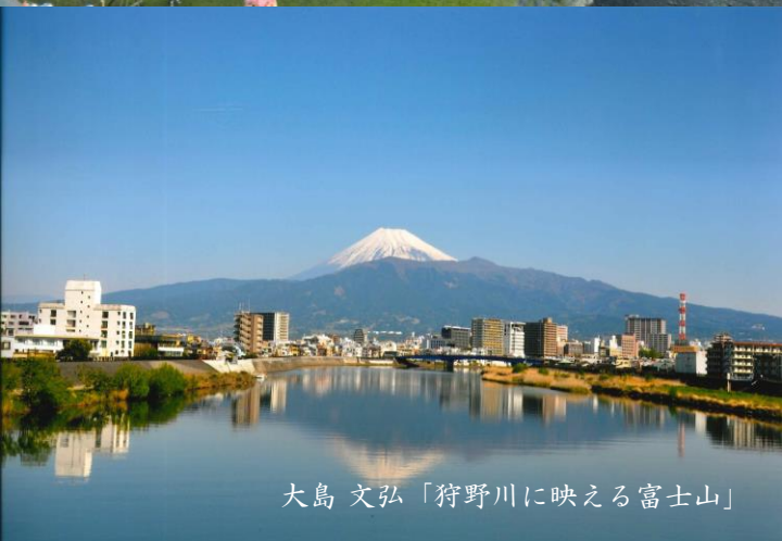
大島 文弘「狩野川に映える富士山」