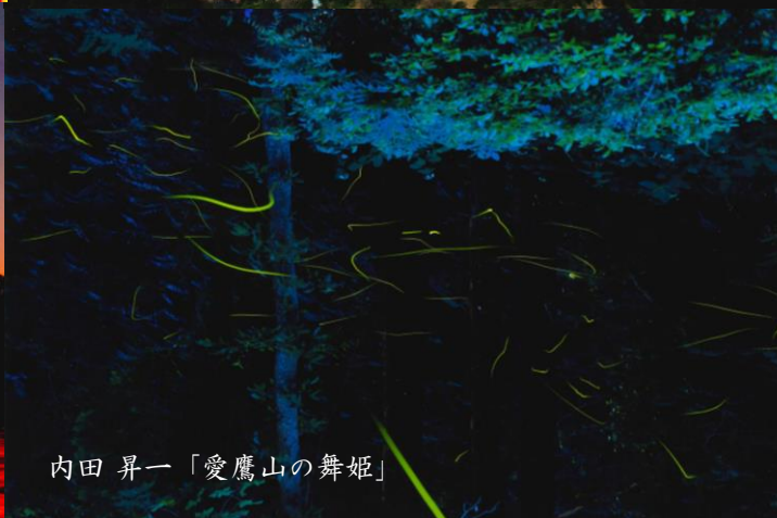
内田 昇一「愛鷹山の舞姫」