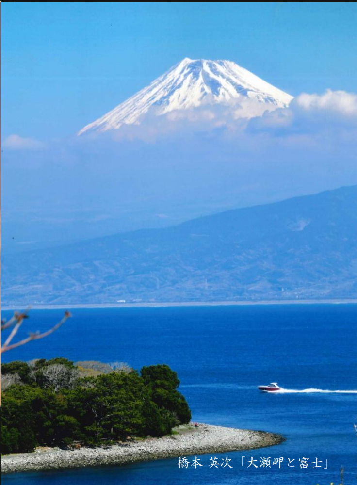
橋本 英次「大瀬岬と富士」