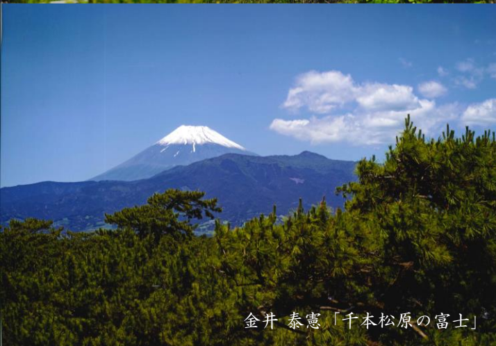
金井 泰憲「千本松原の富士」