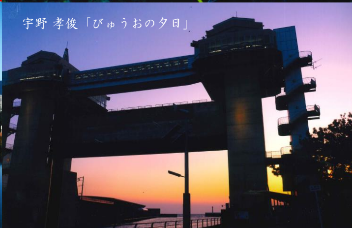
宇野 孝俊「びゅうおの夕日」