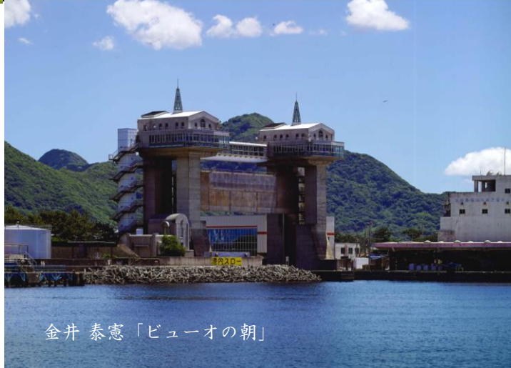
金井 泰憲「ビューオの朝」