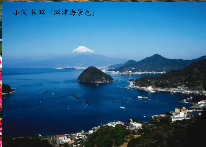
小俣 佳昭「沼津海景色」