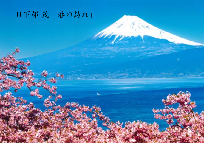
日下部 茂「春の訪れ」