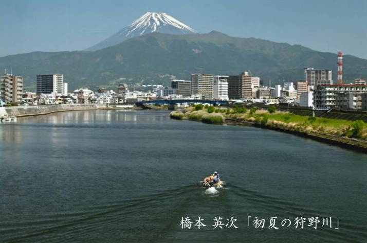
橋本 英次「初夏の狩野川」